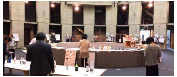
審査会場(京都市立芸術大学)

ジャンルを超えて個人や企業から応募されたデザイン作品が、審査会場の京都市立芸術大学・円形ホールに集結。指先ほどの小さな小物から茶室まで、個性豊かなデザインたちが話しかけてくるような賑わいでした。 多くの応募作品から選ばれた作品とデザイナーは後日、京都府庁「秋の観芸祭」での表彰式で表彰されました。