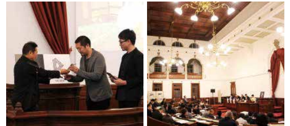
表彰式(京都府庁旧議場)